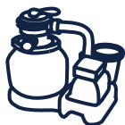
Groupe de filtration YZAKI 5,7m 3 /h